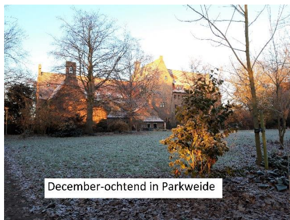
December-ochtend in Parkweide

Ditmaal een kroniek over een wat langere periode. Er zijn rondom de abdij en de abdijtuin dit najaar vele activiteiten geweest. Over de Open Tuindag van 10 september heb ik een aparte kroniek gemaakt en ook over de Landelijke Natuurwerkdag van 5 november. De Open Tuindag was erg succesvol, veel bezoekers, mooi weer en gezellige kraampjes. We hadden drukbezochte workshops "Appelazijn maken" en "Snoeischaar slijpen". Uit de opbrengst van onze verkopen hebben we kleine Euonymus-struikjes gekocht die tijdens de Landelijke Natuurwerkdag in de PAX-tuin zijn geplant. Tijdens die