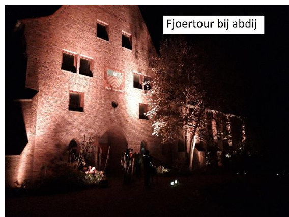
Fjoertour bij abdij

abdijterrein. Het gebouw was feestelijk verlicht, de route over het terrein werd gemarkeerd met tientallen kleine kaarsjes en de hoornblazers lieten hun stemmige sonore winterklanken horen. Bij de winkel hadden de wandelaars even tijd voor een glaasje vruchtenpunch. Gelukkig had de tuingroep enkele dagen tevoren de wandelroutes goed geveegd en struikelvrij gemaakt. Kortom een stemmig evenement en een aanprijzing voor de gastvrijheid van de abdij.