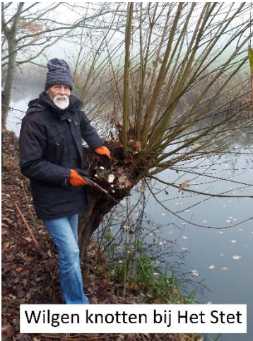
Wilgen knotten bij Het Stet

Algemeen tuinonderhoud: Je zou bijna denken dat we geen tijd hebben overgehouden voor het gangbare tuinonderhoud. Nou, niets is minder waar. Ik noem bijv. de Kruidentuin, de Vlindertuin, de Bostuin, de Parkweide, de Paxtuin, het Vleugelpark, het Broederkerkhof, de Moestuin, de grote Kas, etc. etc. Soms met velen, soms alleen een "wekenlang stug doorwerkende" enkeling. Laatst hebben we de wilgen bij "Het Stet" (achter het broederkerkhof) geknot. Met die "slieten" gaan we komend jaar een nieuw wilgenprieel bouwen. Ook de bramenstruiken hebben afgelopen tijd een "flinke beurt" gekregen.