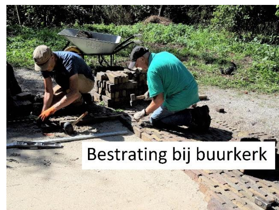
Bestrating bij buurkerk

Buurkerk en kerkhof: Hier hebben we dit najaar o.a. schelpenpaden aangevuld en enkele verhardingen aangelegd, maar eerst even flink gerooid om "licht en ruimte" te scheppen. Voor 2023 staan daar ook weer enkele projecten op stapel.