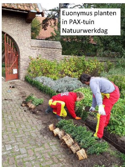
Euonymus planten in PAX-tuin Natuurwerkdag

natuurwerkdag hebben we ook "de Beek" uitgebaggerd, de moestuin opgeknapt en de bostuin opgeschoond. Ook dat was weer een heel geslaagde dag, waar we na de vele voorbereidingen met tevredenheid op terugkijken.