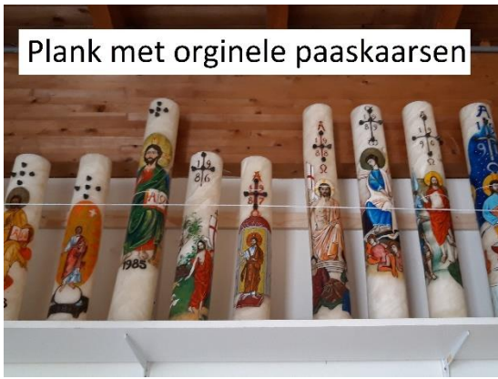
Plank met originele paaskaarsen

Technische klussen: Een aantal vrijwilligers van de tuingroep doen ook steeds meer "technische klussen". Zo weten ze in de abdijwinkel ons te vinden om een kastje te timmeren, de plank met de paaskaarsen te versterken, een rekje hier of daar te maken. In en aan de abdij een dakgoot te repareren, de lekkage in de regenwaterafvoer bij de Sacristie van de abdijkerk op te lossen, een waterkraan onder de abdijkeuken te vervangen. Binnenkort wordt de Kapittelzaal (weer) omgebouwd tot kapel, hetgeen veel energie zal besparen. Voor de retraitegasten is het wandelpaadje opnieuw betegeld en is er extra straatverlichting aangelegd achter het abdijgebouw. De houten wanden van onze eigen gereedschapsschuur waren bij de ramen