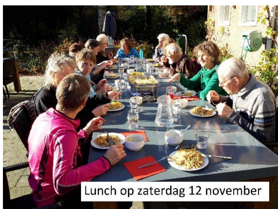
Lunch op zaterdag 12 november